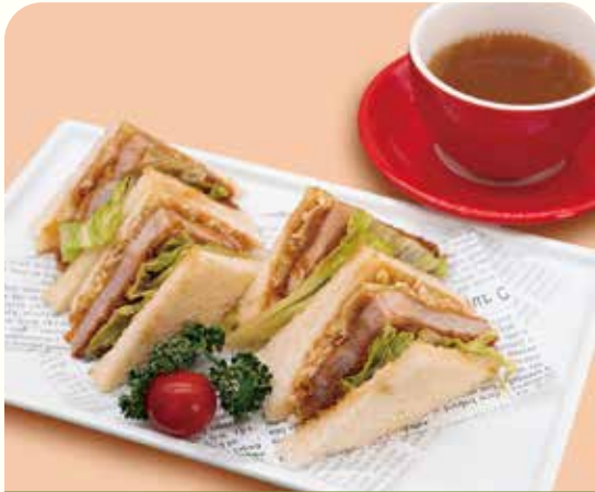
大吉ポークのロースかつサンド